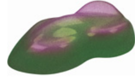
magic green-purple - Colour change

Bei der neu entwickelten FOLIATEC.com Karosserie Sprüh Folie handelt es sich um die neue Generation der wiederablösbaren Karosseriebeschichtungen.