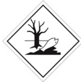
Klasse UG (II)