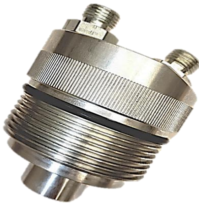
Adapter 400.444.000 Anschluss anstelle des Ölfilters