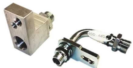
Adapter 400.440.000 Anschluss zwischen Ölkühlerleitung und Getriebe