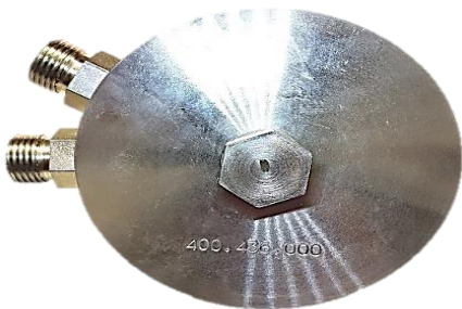
Adapter 400.436.000 Anschluss anstelle des Ölkühlers