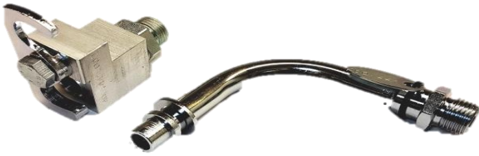
Adapter 400.441.000 Anschluss zwischen Ölkühlerleitung und Getriebe