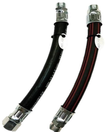
Adapter 400.438.000 Anschluss in die Ölkühlerleitung