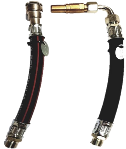
Adapter 400.435.000 Anschluss am Ölkühler