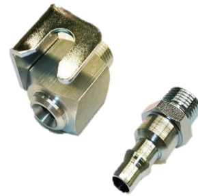
Adapter 400.452.000 Anschluss zwischen Ölkühlerleitung und Ölkühler