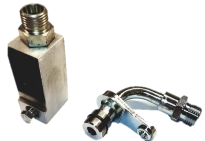
Adapter 400.437.000 Anschluss zwischen Ölkühlerleitung und Getriebe