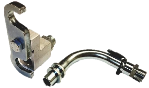
Adapter 400.442.000 Anschluss zwischen Ölkühlerleitung und Getriebe