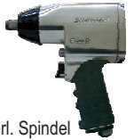
UT 8145RE 1/2" Schlagschrauber UT 81452RE 1/2" Schlagschrauber mit 2" verl. Spindel