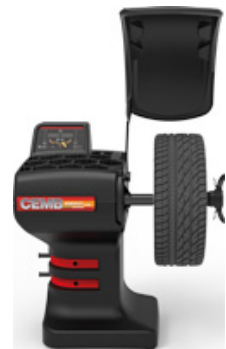
ER 60 Pro