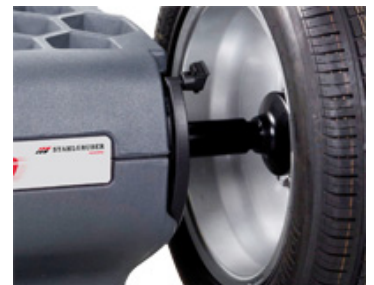
Messarm bis 28"