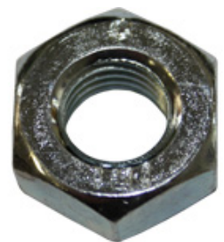
Sechskantmutter, galvanisiert u. verzinkt