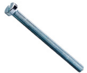
Zylinderschrauben mit Schlitz