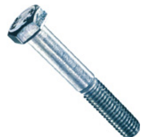
Sechskantschrauben mit Schaft