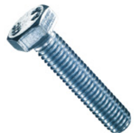
Sechskantschrauben mit Gewinde bis Kopf