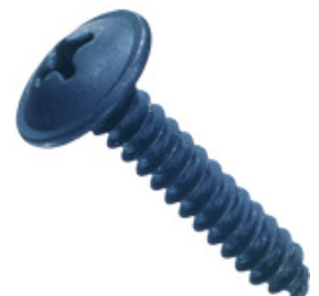
Blechschauben mit Linsenkopf