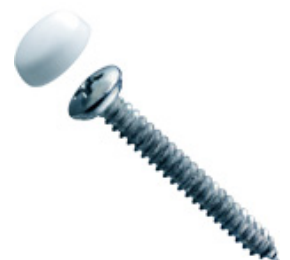
Schilderschrauben mit weißen Kappen