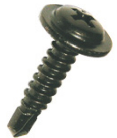
Bohrschraube mit angepresster Scheibe