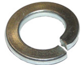
Federringe galvanisch verzinkt