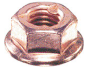
Kupfermuttern mit Bund