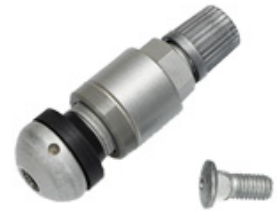
RDV Generation 2

Achtung: Bei jeder Neureifen Montage muss das RDV gewartet bzw. gewechselt werden!