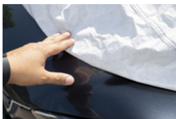
Mit lackschonendem Vlies auf der Innenseite und PVC-Beschichtung auf der Außenseite