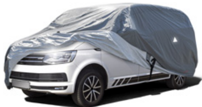
All Weather Plus