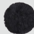
Mirka Lammfellpad Pro schwarz