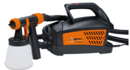
FOLIATEC Sprühsystem powered by Wagner

Das hochwertige FOLIATEC Sprüh System powered by WAGNER, einem weltweit führenden Hersteller von Geräten zur Oberflächenbeschichtung, wurde speziell für den Einsatz der FOLIATEC.com Karosserie Sprüh Folie entwickelt – so kann man direkt loslegen.