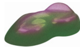
magic green-purple - Colour change

Bei der neu entwickelten FOLIATEC.com Karosserie Sprüh Folie handelt es sich um die neue Generation der wiederablösbaren Karosseriebeschichtungen.