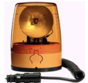
KL JuniorPlus M