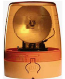
KL JuniorPlus F