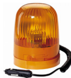
KL Junior M