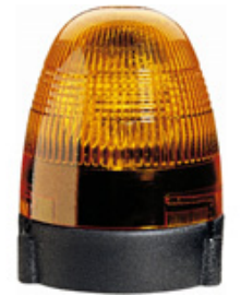
KL Rotafix F