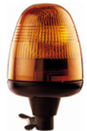
KL Rotaflex R