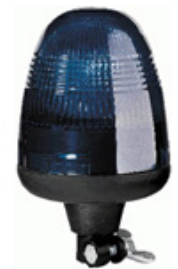
KL Rotaflex R