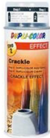
Crackle Effekt Spray