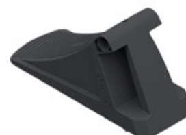
UK 36 KL