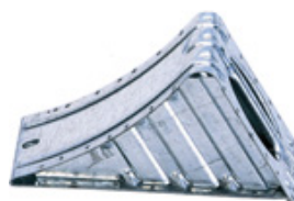
UK 36 St