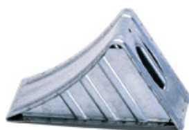
UK 46 St