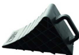
UK 46 K