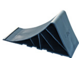
UK 10 K