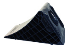
UK 53 K