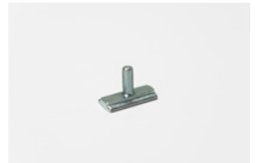
Nutenstein mit Gewindebolzen