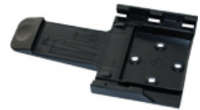
HA 10 K