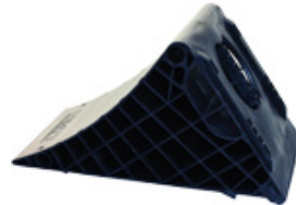
UK 53 K