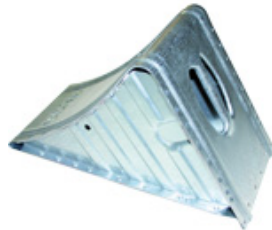
UK 53 St