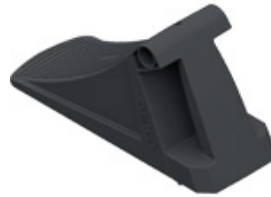
UK 36 KL