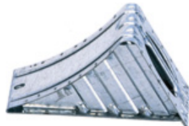
UK 36 St