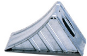
UK 46 St