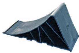
UK 10 K