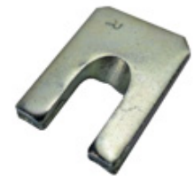
444 4320 Abb. ähnlich