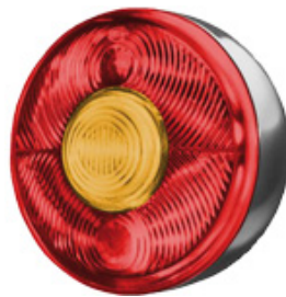
112 0934 / 112 0941