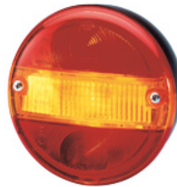
112 0910 / 112 1373